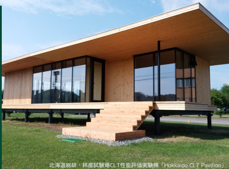
北海道総研・林産試験場CLT性能評価実験棟「Hokkaido CLT Pavilion」