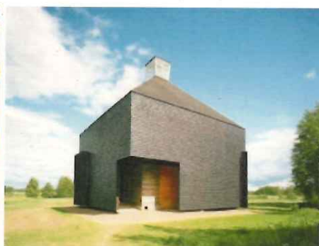
(中) フィンランドの伝統的ログ構法による カルサマキ教会(OOPEAA)