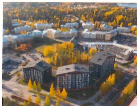
(左) CLTモジュラーユニットを用いた8階建て 集合住宅ブークオッカ(OOPEAA)