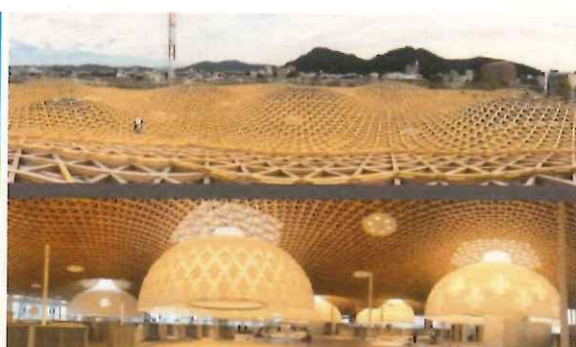
(右) ぎふメディアコスモス(伊東豊雄建築設計事務所)