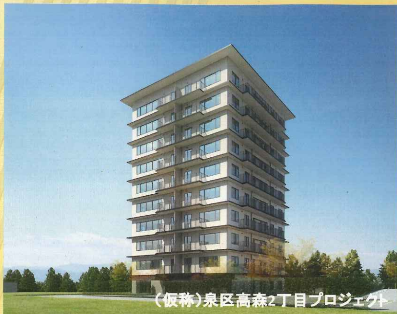
(仮称)泉区高森2丁目プロジェクト